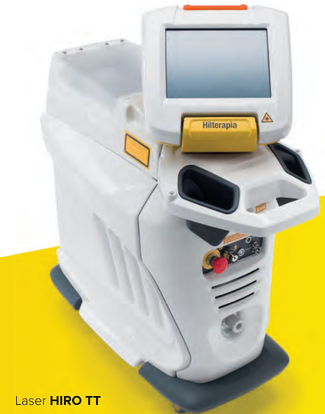
Laser HIRO TT